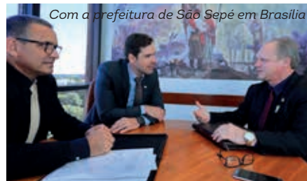
Com a prefeitura de São Sepé em Brasília