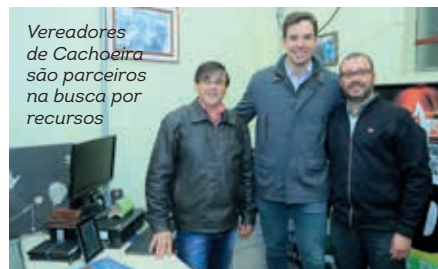
Vereadores de Cachoeira são parceiros na busca por recursos