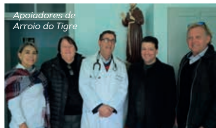
Apoiadores de Arroio do Tigre