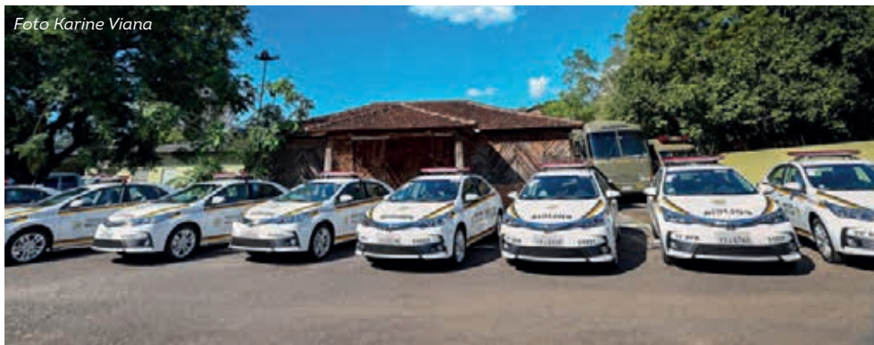
Segundo lote de viaturas entregues, em 2018 teve 12 carros