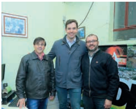
Vereadores de Cachoeira são parceiros na busca por recursos

Foram criadas linhas de crédito para pequenas e médias empresas pelo Banrisul, com R$ 1,5 bilhão, e o Badesul Pequenas Empresas, em apoio à geração de emprego.