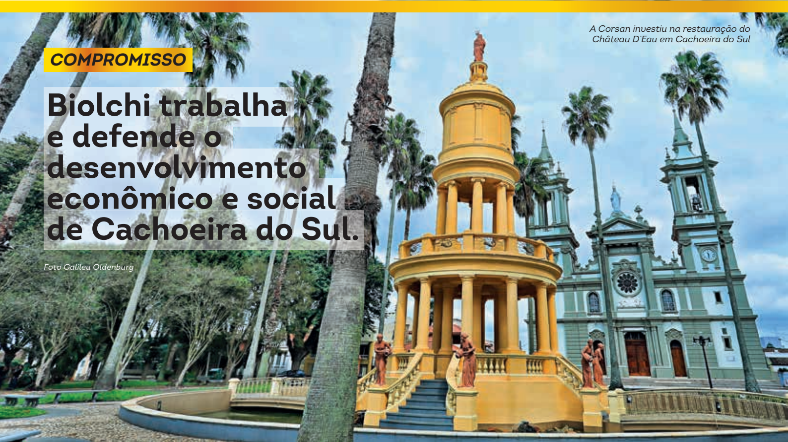
A Corsan investiu na restauração do Château D'Eau em Cachoeira do Sul