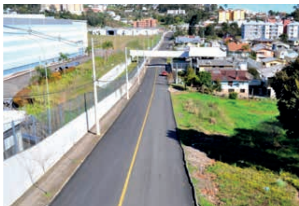
Pavimentação da Rua João Dentice, Bairro Triângulo.

A parceria de Biolchi com Carlos Barbosa já trouxe resultados para o município. Entre 2015 e 2018, mais de R$ 800 mil foram aplicados nas áreas da saúde, infraestrutura e esporte.