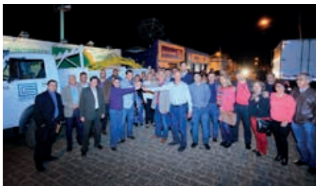
Biolchi na entrega caminhão do tipo ualetadeira para Corsan de Pinheiro Machado

Houve conclusão do asfaltamento da ERS-737, que liga Arroio do Padre à região de Pelotas e à BR-116. Os 25 km de asfalto vão facilitar o escoamento da produção e da população. A obra foi entregue por Sartori.