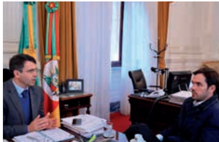
Biolchi e Branco também intermediaram a cessão de uso de um caminhão com reboque prancha para município de Jaguarão