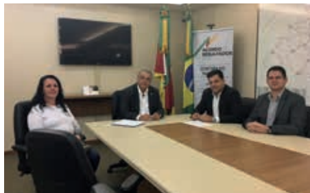
Equipe busca construção de passarela junto à ponte sobre o Rio Camaquã em Lauras do Sul