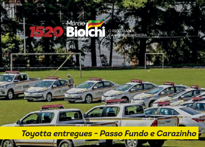
Toyota entregues - Passo Fundo e Carazinho