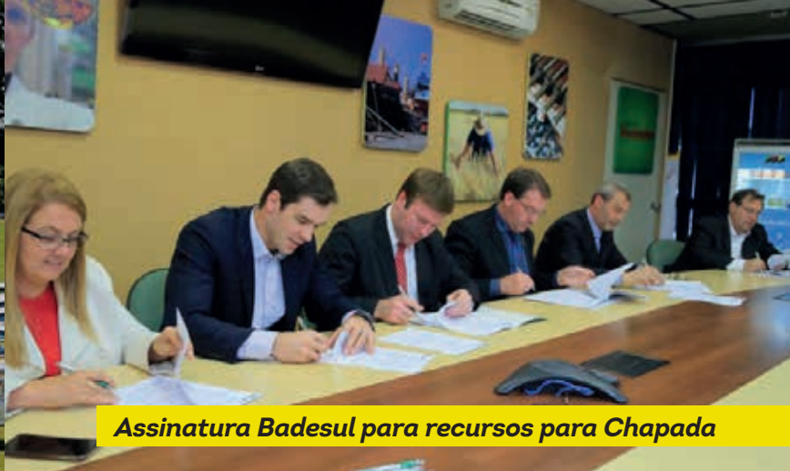
Assinatura Badesul para recursos para Chapada