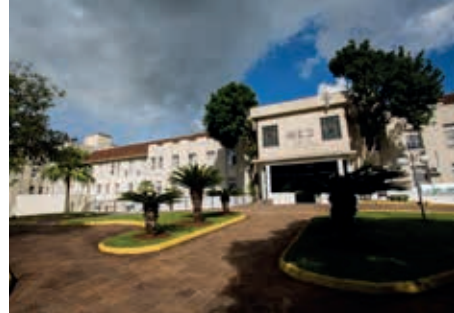
Hospital de Caridade de Carazinho (HCC) já realizou diferentes investimentos

• Nova UPA: com repasse de R$ 600 mil do governo do Estado para compra de equipamentos, UPA está atendendo a população.