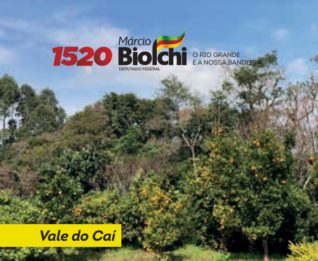
Vale do Cai